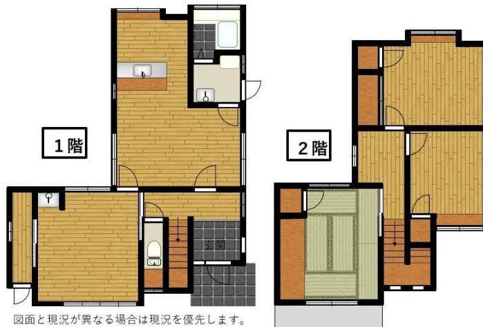
図面と現況が異なる場合は現況を優先します。