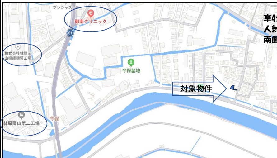
図面と現況が異なる場合は現況を優先します。

車4台駐車可能（縦列駐車）です。 人気の対面キッチンです。 南側に庭があり日当たり良好です。